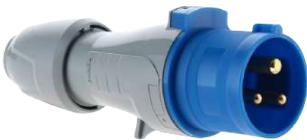
Industrial single-phase case 16 Amp