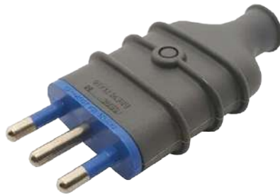
Enfuche Single Phase Domestic 16 Amp