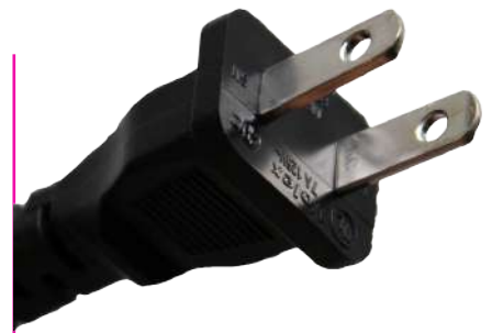
American Case 110 V